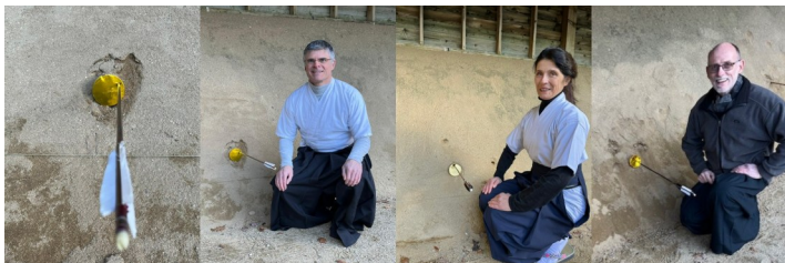
Tir à la cible d'or 2026 : Félicitations aux 3 heureux « ciblors »

Stage d'automne CTKara : du vendredi 09 au dimanche 11 octobre 2026